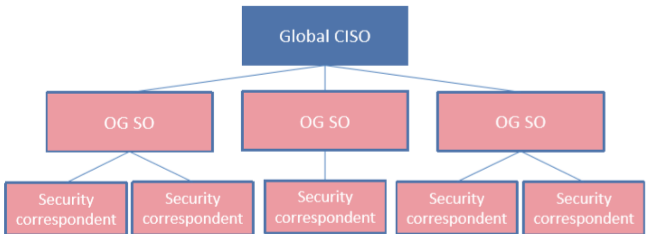
Figure 3 - Organización de la gobernanza de ISS de Bureau Veritas

La gobernanza también incluye cualquier rol relevante para la animación de la Seguridad del Sistema de Información dentro de las actividades de negocios, funciones de control, gestión de proyectos y Dirección.