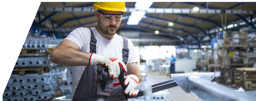
SALUD & SEGURIDAD