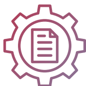
SISTEMAS DE GESTIÓN